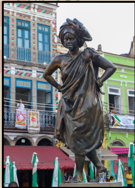
Bailarina e coreógrafa Mercedes Baptista

End: Rua Major Gote 1901 - Centro, Patos de Minas, Minas Gerais (MG), Universidade