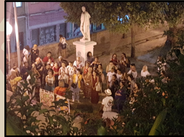
Caminhada pela Pequena África Jardim Suspenseo do Valongo