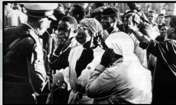
Mulheres e um policial durante manifestação em Sharpeville 1969

Em um ano marcante, em que celebramos os 30 anos da Marcha de Zumbi (1995) e da II Marcha Nacional de Mulheres Negras, que acontecerá em 25 de novembro deste ano, lembramos do feminicídio de Beatriz Nascimento, ocorrido há três décadas. A Campanha revela ainda mais significado com esses marcos tão representativos da luta antirracista. Nós entendemos que a juventude negra segue sendo o principal alvo da violência policial, enquanto as mulheres negras enfrentam crescentes violências e violações, seja no trabalho, na educação ou nos alarmantes índices de mortalidade materna. As religiões de matriz afro-brasileira continuam sob ataques de grupos fundamentalistas, e povos indígenas