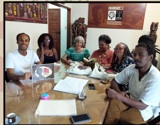
Reunião no Ipeafro em 2019

Período expositivo: Até 29 de junho de 2025 Entrada gratuita.